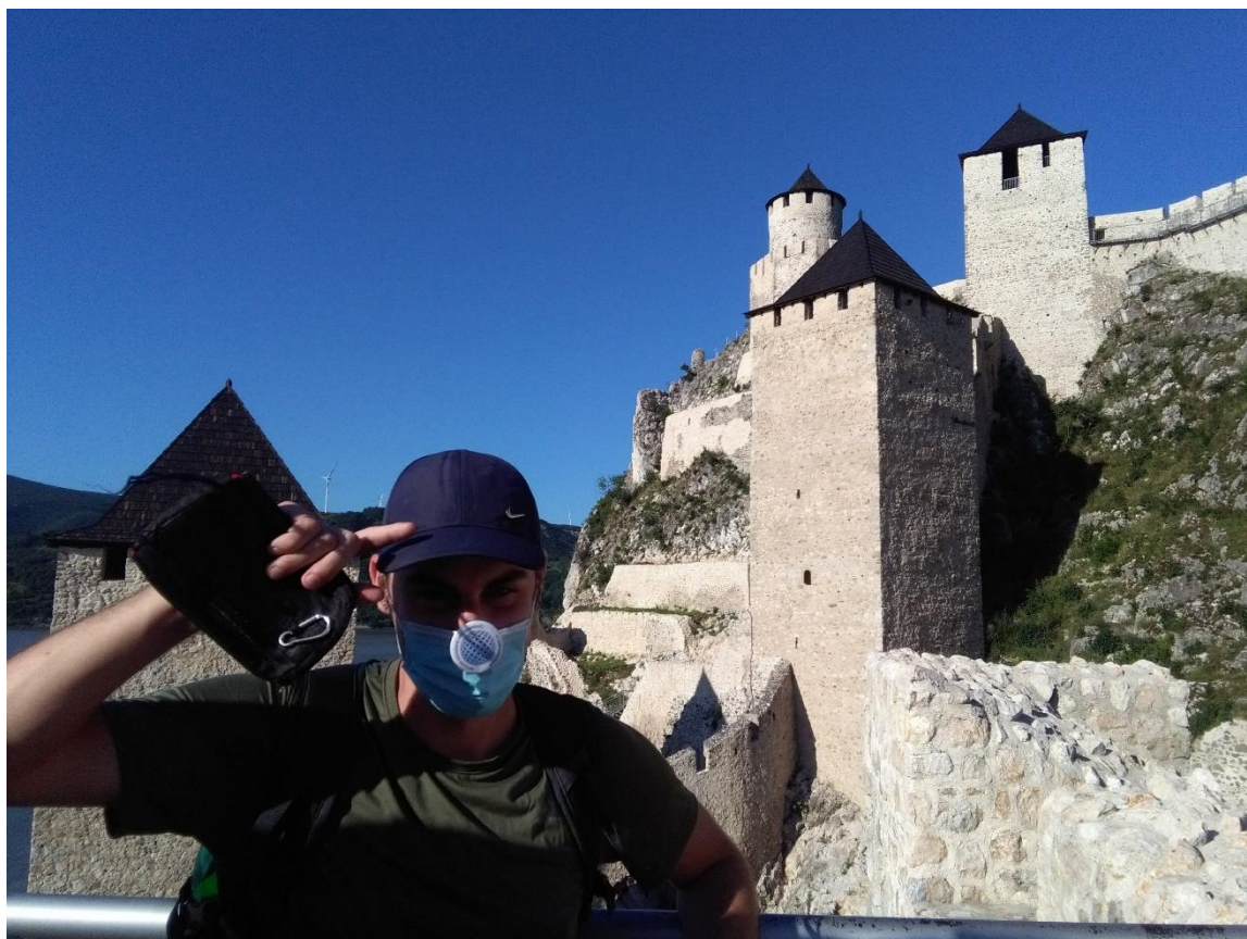
Obr. 5: Hrad Golubac