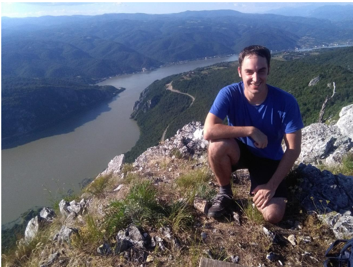
Obr. 6: Národní park Djerdap