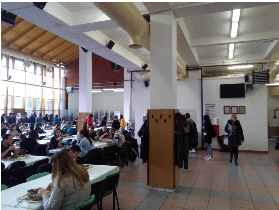
Obr. 2: Hlavní univerzitní menza