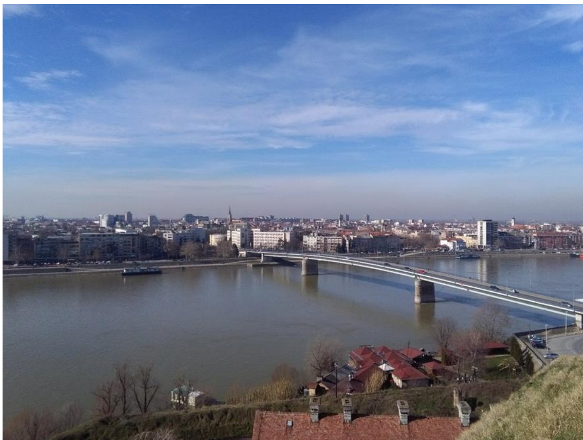
Obr. 1: Na Petrovaradinské pevnosti s výhledem na Dunaj a Nový Sad