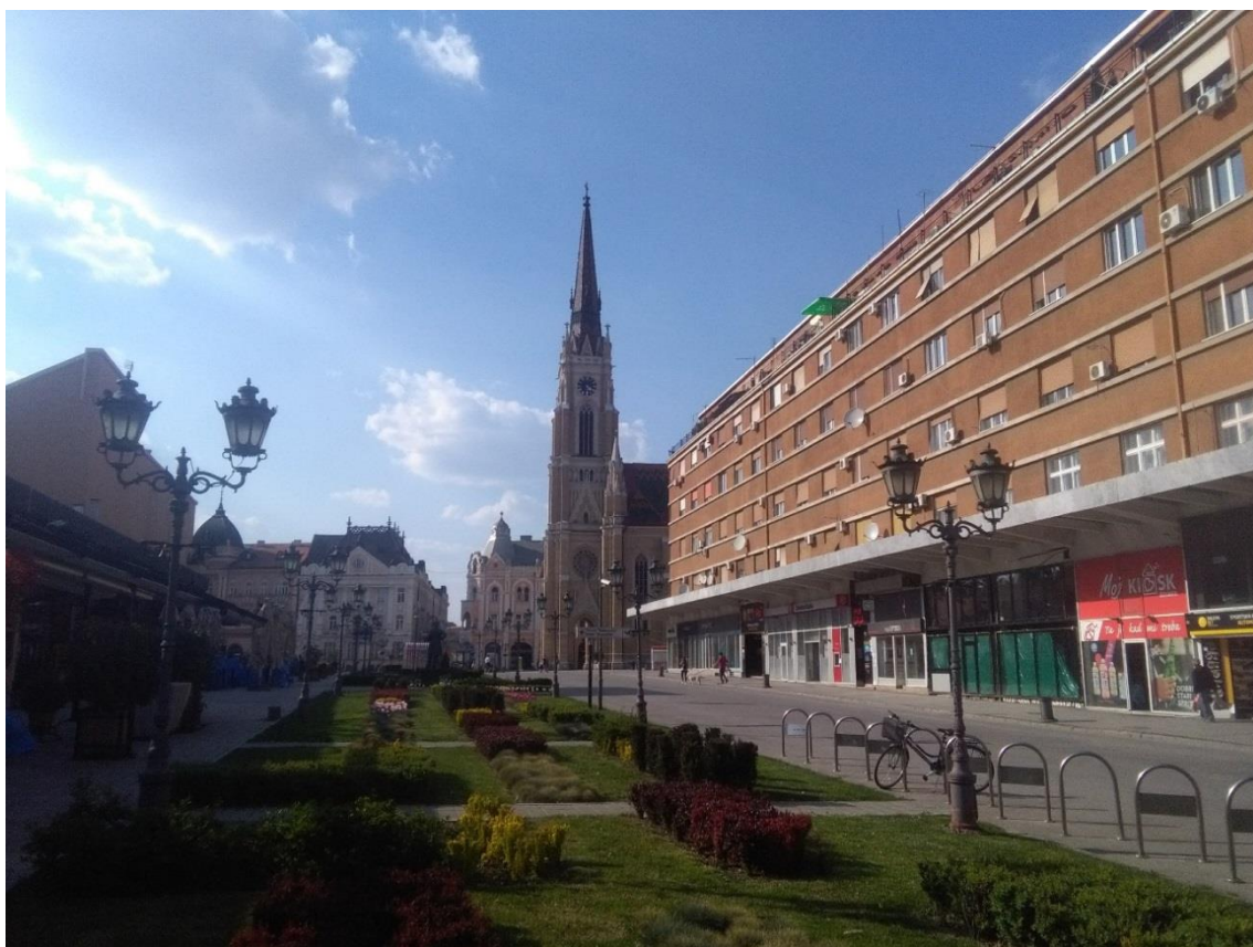
Obr. 3: Centrum Nového Sadu během jarních pandemických opatření